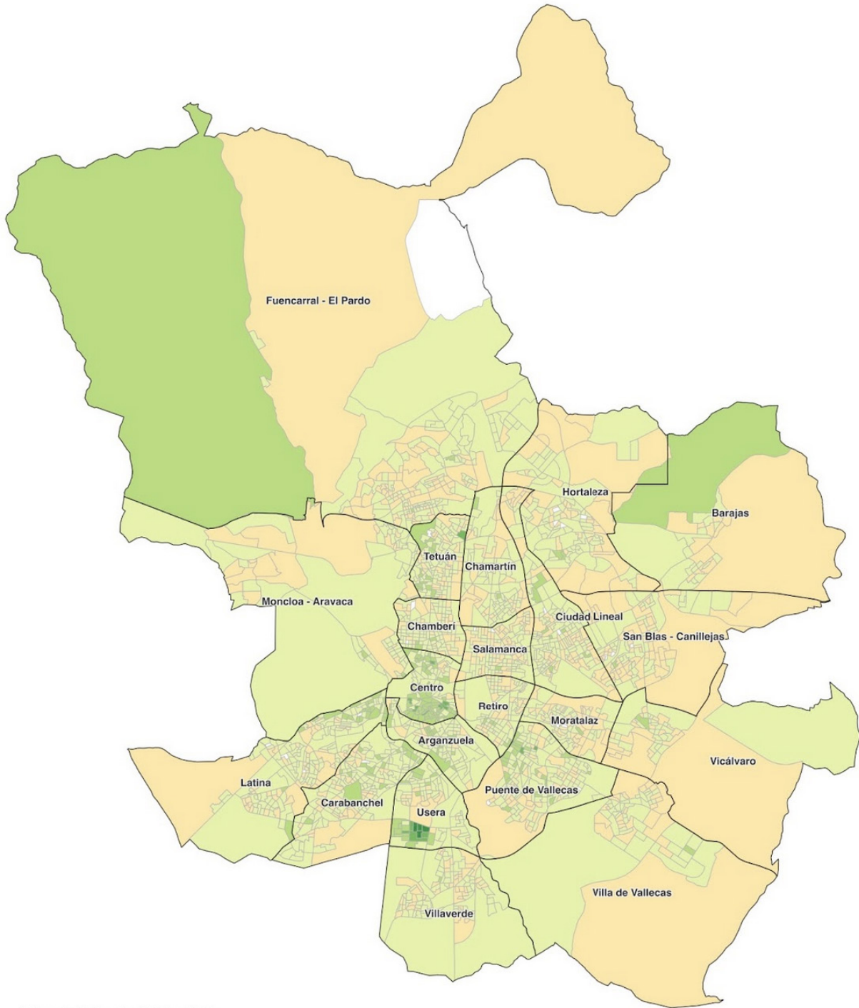
Diferencia % de votos (2023 - 2021):